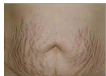
סימני מתיחה - השמנה והרזיה

עיקר הנשים המתלוננות על התופעה חוות סימני מתיחה עקב עלייה מהירה במשקל ו/ או הריונות, כגון: הריונות עם עובר כבד משקל או הריונות מרובי עוברים.