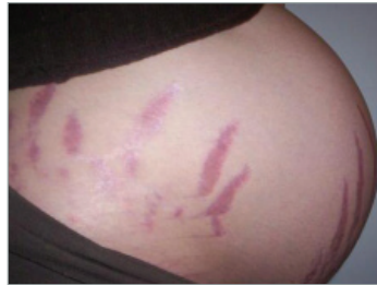
סטריאה - בטן הריונית

כמו כן נצפו סימני מתיחה מגורם גנטי ואם בודקים את ההיסטוריה המשפחתית מגלים כי לקרבות משפחה יש אותם התסמונות.