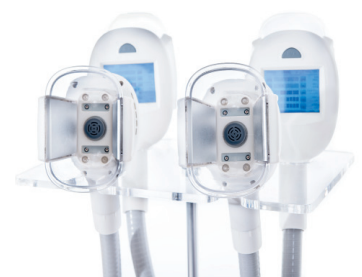
4 ידיות לפי האזור

הטיפול אינו מלווה בתהליך דלקתי ועל כן הנקרוזה (מוות תאי לא מתוכנת) אינה מייצרת עומס על מערכת ההלמפטית, כבד וכליות. טיפול הקריוליפוליז THR CRYO נחשב לאלטרנטיבה לניתוח שאיבת שומן ליפוסקסן. לפי הנסיון המחקרי THR CRYO מאפשר להקטין משמעותית את נפח שכבת השומן באזור הטיפול עד כדי 20-40%. הוכח כי תאי השומן לא מסוגלים להתאים עצמם לטמפרטורות נמוכות ביחס לתאים אחרים (עור, עצבים, כלי דם). בזמן קירור